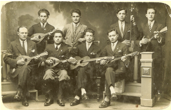
Bildtext: Ursprungliga versionen av Stahlhammer Klezmer Band ca: 1930

Efter nazisternas invasion av Polen blir den judiske tonåringen Mischa Stahlhammer internerad i ett tyskt arbetsläger. Han lyckas fly, ansluter sig till de polska partisanerna och blir expert på att aptera och desarmera minor. Stora delar av hans släkt raderas ut i förintelsen men Mischa överlever och hamnar 1948 i Sverige.